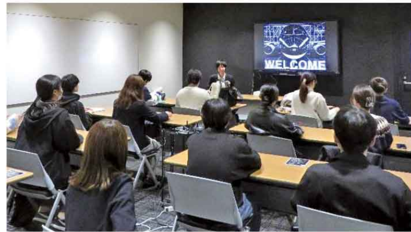
スターフライヤー

学生が企業を訪問し、優れた技術・サービスなどを現場で感じてもらい、北九州市で働くイメージを強くもってもらうことができました。