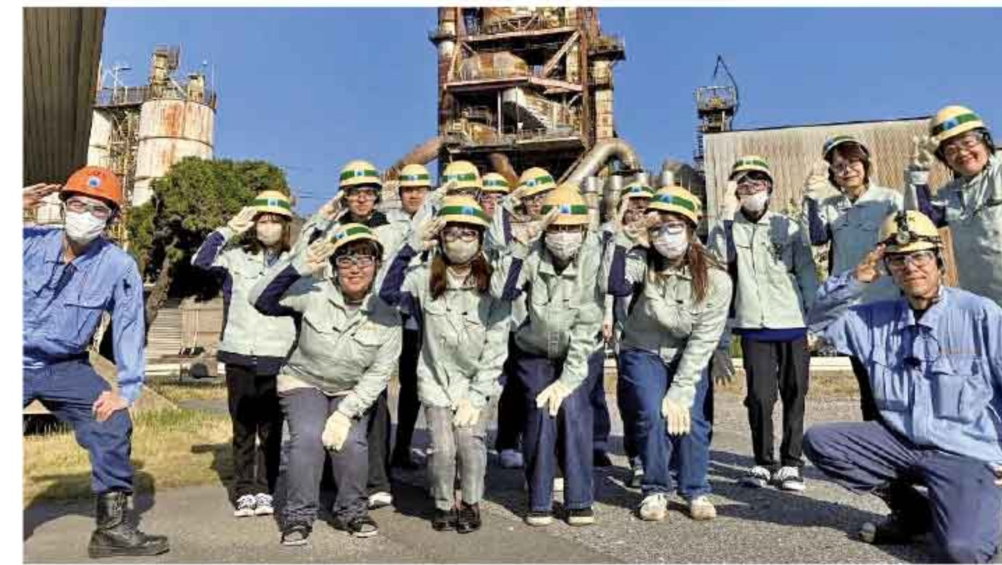
日鉄高炉セメント