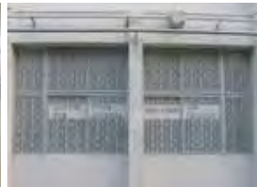
(2号館1階) 個性的な窓ガラスが目印です