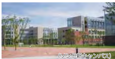
(ソンド新キャンパス)

授業もおもしろく充実しています。韓国留学生とペアを組んで作業したり、韓国語でレジュメを作り発表したりなど、大変ですが力のつく内容だと思います。実際に韓国で生活をしてみて、韓国留学に来て本当によかったなと感じています。来年の交換留学に続くように、私たち第一期生！残りの日々も頑張っていきたいと思います。