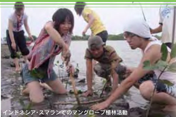
インドネシア・スマランでのマングローブ植林活動