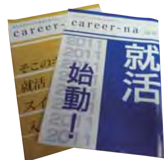
〈キャリアセンター広報誌「キャリアーナ」〉