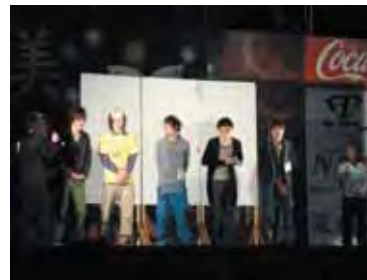
ステージイベントの様子

今回は、新しい企画から恒例の企画、地域交流企画など催し物がとても充実しており、学生としての自主活動や研究活動の成果を十分に発揮し、地域社会に貢献することができました。