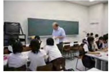
高校生対象のサマースクールの様子(平成20年8月)

今回は、「住民・団体に関する設問項目」で満点を獲得しており、出前講座数や小中高校向け講座数が多いことが評価されています。その他、平成20年度には北九州学術研究都市への連携大学院カーエレクトロニクスコースの設立、日本政策金融公庫との産学連携協定締結などを展開しています。