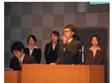
本学の学生サポーターグループ「Navy Wavy」 (5ページに関連記事)