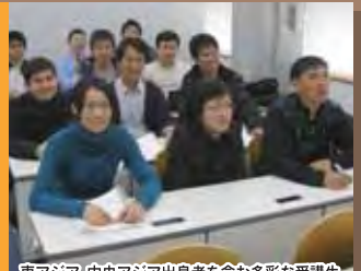
東アジア、中央アジア出身者を含む多彩な受講生