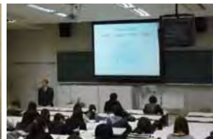
〈就職情報収集法セミナー〉