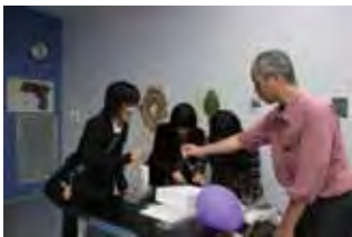
オープンキャンパス

これからも「ひびきの大学祭」を通して、ひびきのキャンパスを大いにPRしていきたいと考えています。