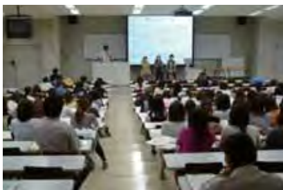
〈インターンシップガイダンス〉