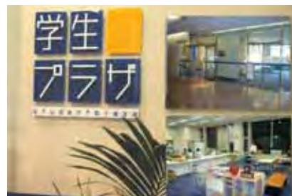
〈キャリアセンター〉