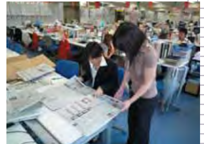
〈企業での就業体験〉

「北九大学生を求める」企業を学内に招いて、人事担当者と、より近い距離で、より詳しく企業を知ることができる、単独企業説明会を実施しています。