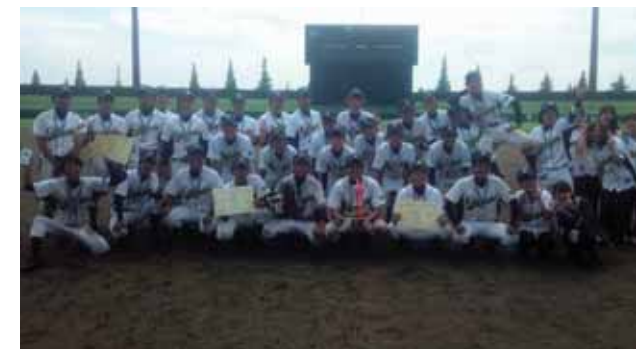
軟式野球部 【団体】 ..... 第35回全日本学生軟式野球選手権大会にて準優勝という成績を収めた。