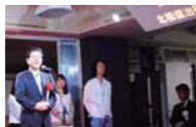
オープンセレモニーでは、市長や来賓者へ向けて学生たちがステーションやESDについて、プレゼンテーションを行いました。

3月17日(日)にステーションオープンセレモニーと ESD市民フォーラム(特別講座)を行いました。