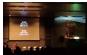
フォーラムでは、時代の先を見続けるCMクリエイターの前内道彦(やないみちひこ)さんをゲストに、約300名の学生・地域の方を迎えたトークイベントを行いました。