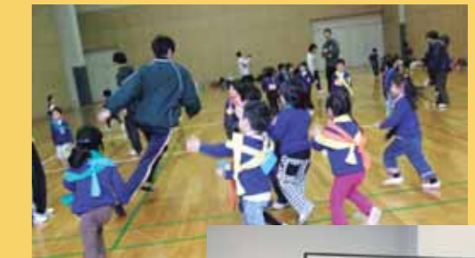
幼稚園児を大学に招いて運動プログラムを提供する活動

学生には、言葉では語られない部分の五感をしっかり感じながら、様々な年代や立場の違う人との関わりを大切に、多角的な方向から物事を考えて判断できる人になってほしいと考えています。