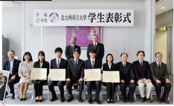
平成27年度 北九州市立大学 学生表彰式

本学では平成17年度より、特に優れた業績をあげた学生を対象に学生表彰を実施しています。これは優秀な業績をあげた者を表彰することで学生にインセンティブを与え、学内に活力を与えようとするもので、ひいては地域社会の活力となるようにと創設しました。平成27年度は学術研究活動の分野で優秀な成績を取めた以下の学生を表彰しました。