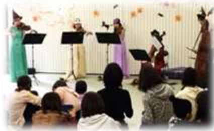
響ホール室内合奏団のみなさん