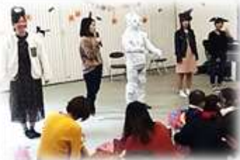
学生さんとコラボ