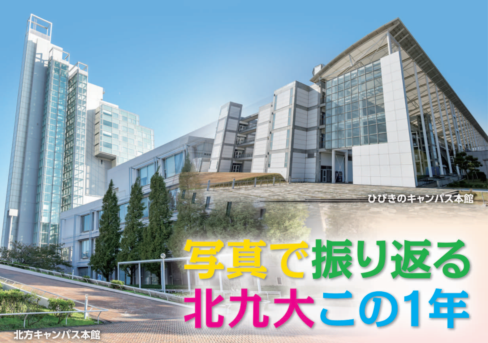
ひびきのキャンパス本館