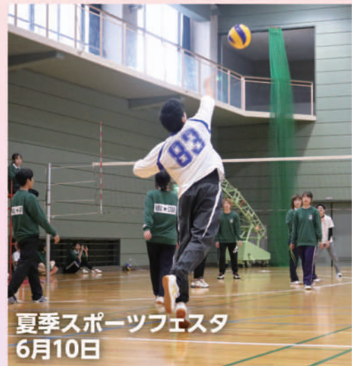
夏季スポーツフェスタ 6月10日