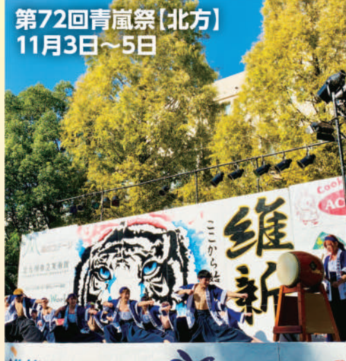
第72回青嵐祭(北方) 11月3日~5日