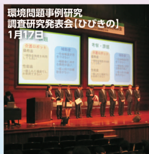
環境問題事例研究 調査研究発表会【ひびきの】 1月17日