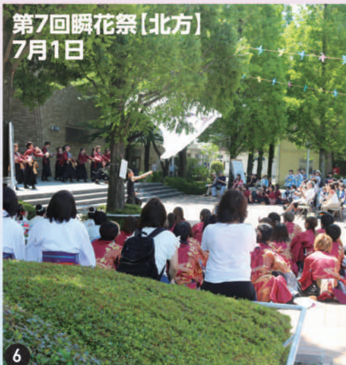
第7回瞬花祭〔北方〕 7月1日