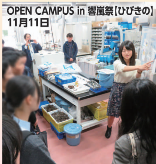
OPEN CAMPUS in 響嵐祭【ひびきの】 11月11日