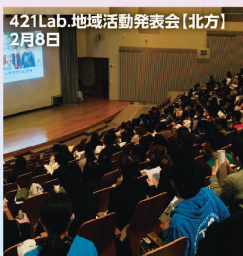
421Lab.地域活動発表会(北方) 2月8日