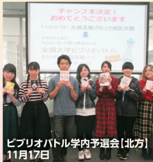
ビブリオバトル学内予選会(北方) 11月17日