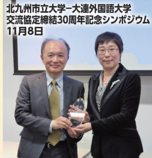
北九州市立大学-大連外国語大学 交流協定締結30周年記念シンポジウム 11月8日