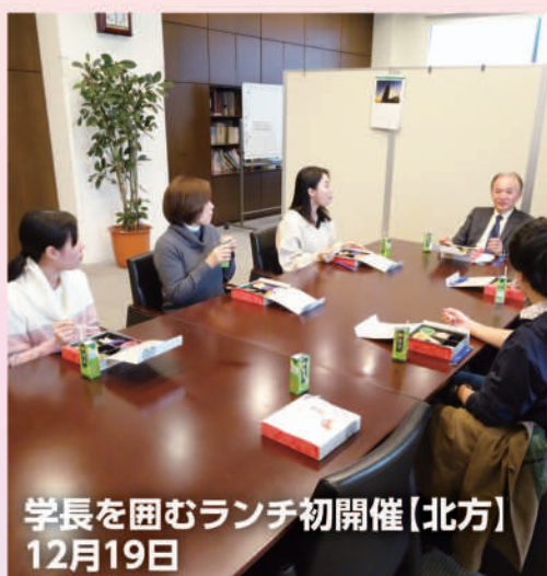
学長を囲むランチ初開催(北方) 12月19日