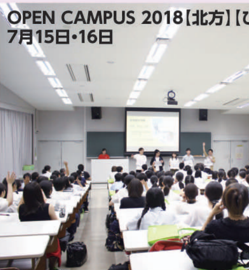
OPEN CAMPUS 2018〔北方〕〔ひびきの〕 7月15日・16日