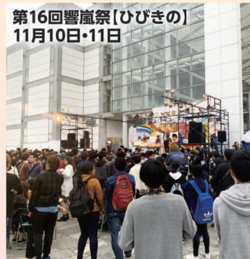
第16回響嵐祭【ひびきの】 11月10日・11日