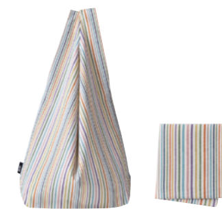
⑨ 小倉織シンプル バッグS&小風呂敷 (ハンカチ)セット (柄名:白多彩)[小倉 縞織]