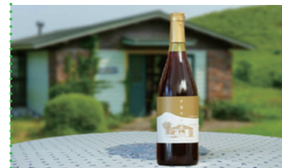
⑧ 平尾台ワイン「ピノ ノワール」 [ドメヌス・ル・ミヤキ]