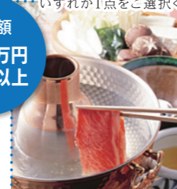
⑩ 小倉牛特選ロース しゃぶしゃぶ肉700g[野村肉舗]