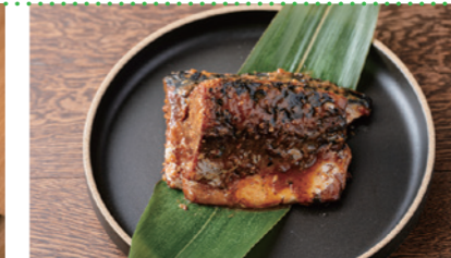
⑥ ぬか味噌炊きセット [宇佐美商店/旦過市場]