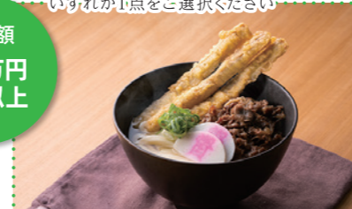
⑤ 肉ごぼ天うどん5人前[資さんうどん] ※写真はイメージです