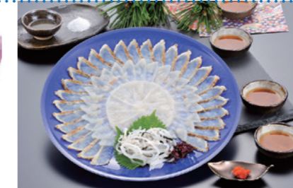
⑪ ぶく太郎本部 食楽庵ふる川 ぶく刺三種盛り [北九州観光コンベンション協会]

※返礼品は、追加・変更となる場合があります。北九州市立大学基金ホームページでご確認ください。