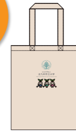
② オリジナルトートバッグ