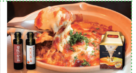
⑦ プレミアム焼きカレー5個と 曾根の紫露(醤油)・ だいたいポン酢セット [プレミアホテル門司港]