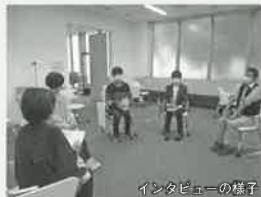
インタビューの様子