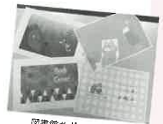
図書館サポーター制作 のブックカバー