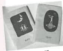
北方キャンパス 生協ショップのブックカバー