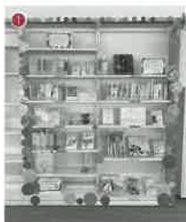
① 図書館3階の閲覧席側に書架があります