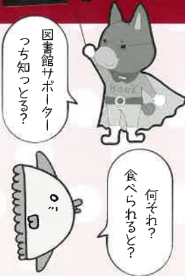
図書館公式キャラクター よむけん とよまんぼう