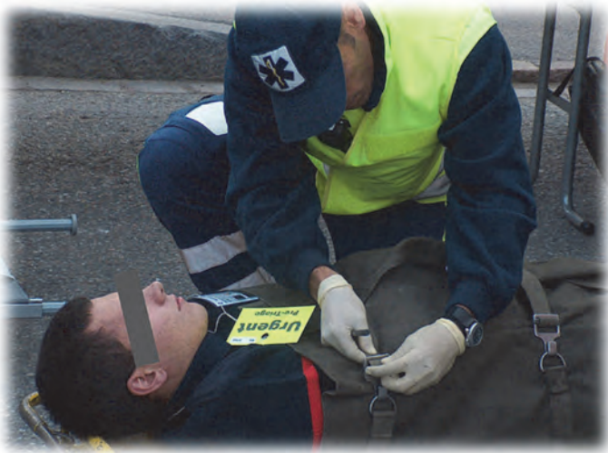
Triageübung mit Kennzeichnung eines Patientendarstellers durch Sanitäter anlässlich der Übung „Senza Limiti“ der Schweizer Feuerwehr und des Katastrophenschutzes, in Wikipedia, available at: https://commons.wikimedia.org/w/index.php?curid=5168271 (last accessed: 2024.8.25) .

日本・ドイツ医事法シンポジウム / Japanisch-Deutsches Symposium zum Medizinrecht