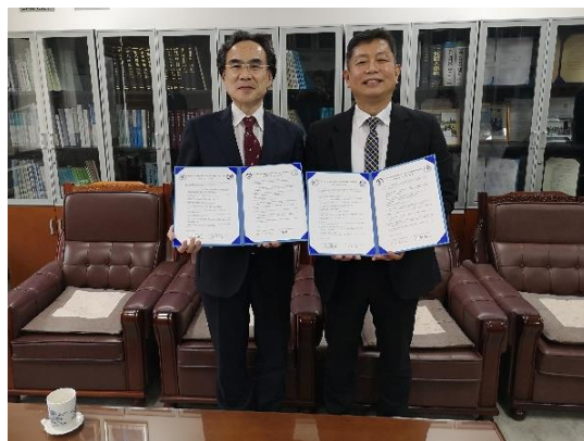
調印式後の記念撮影

3月7日(木)に、韓国の国立釜山大学の研究機関である「社会科学研究院」と、教員・研究者の交流及び共同研究などに関する国際交流協定を締結しました。当研究院は、2007年に社会科学分野の7つの研究所が統合して発足した研究機関で、国や地域の課題解決、社会科学分野の学問的な深化を目的にしている地方拠点研究機関です。調印式では、北九州と釜山の両地域が抱えている課題の類似性に共感し、有益な交流を進めていくことで合意しました。今後、両機関の交流を通じて、両地域の課題解決や持続可能な発展に対して、国際的・学際的な研究成果を上げていくことを目標とします。