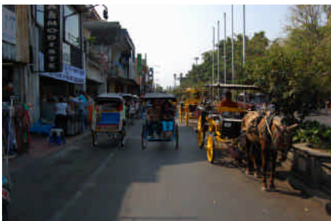
写真2 ベチャが走行・待機するマリオボロストリート