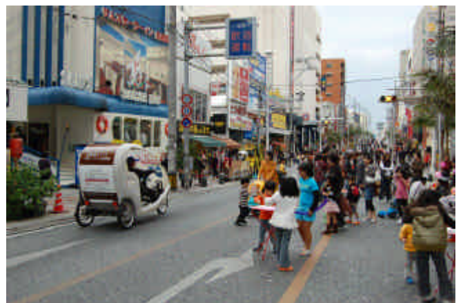
写真1 トランジットモールを走行するペロタクシー

またペロタクシーは、単一移動を目的とした従来型タクシーと、案内ガイド付き観光バスの両方の良さをあわせ持っている。その長所を活かして、高齢者の生活支援サービスでの利用時はドライバーが高齢者の話し相手になり、子どもの塾の送迎利用時はドライバーがボディーガード代わりになるなど、両者の関係性が密接になる点も特徴である。単なる移動手段としての乗り物ではなく、本来は脇役であるはずのドライバーが重要な役割を担い、車両とドライバーとが一体となった総合交通手段と言える。