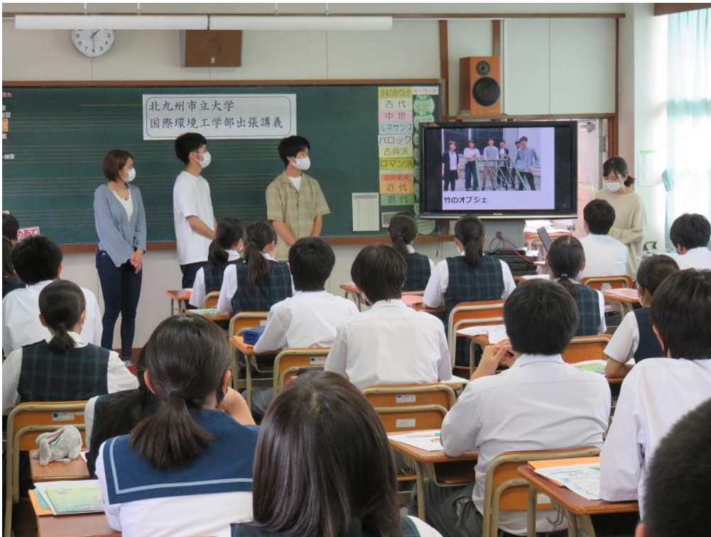
北九州市立白銀中学校での出張講義の様子