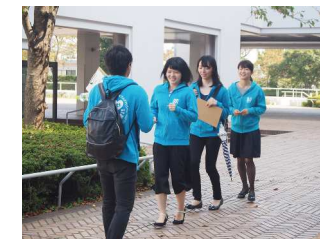
↑発表の練習をするエコスタイルカフェのメンバー

エコスタイルカフェは「cool citizen of Kitakyushu - 北九州の市民の力 -」、YAHATA HAHAHA! PROJECTは「HAHHAHA! LINKS YAHATA WITH THE WORLD - YAHATAのHAHHAHAが世界をつなぐ -」というテーマでプレゼンを行いました。動画を使用した