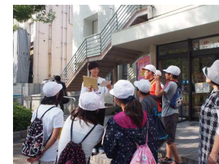
↑キャンパスツアーの様子