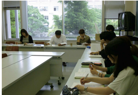
エコスタイルカフェプロジェクト

7月4日(金)に10月開催予定の「エコライフステジ2014」の出展に向けて企画の発表を行いました。この日は、新メンバーによる企画のプレゼンが行われました。イベントに出展するにおいて「学生らしさ」を大切にすることが求められています。発表のあと、実行委員会の方々から「学生ならではの視点を活かすとさらに良い企画になる」とアドバイスをいただきました。