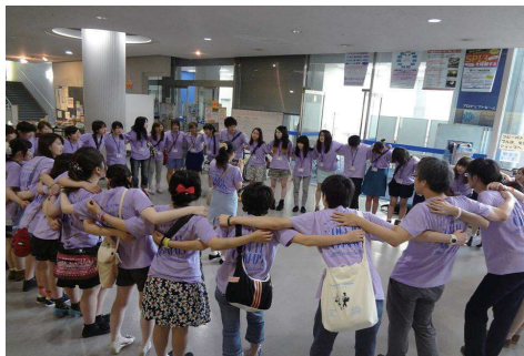
オープンキャンパスプロジェクト

7月12日(土)・13日(日)に「ありのままの北九大みせるのよ～少しも隠さないわ～」のテーマのもと、北九州市立大学のオープンキャンパスが行われました。キャンパスツアーやサークル体験など、高校生に大学生活を少しでも体験してもらおうと取り組んできました。2日間で2,879人の高校生が来場し、大学は活気にあふれていました。