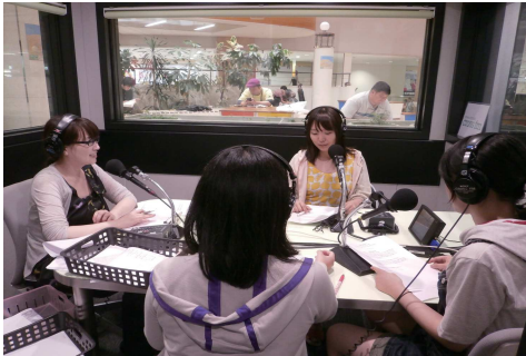
キタキュースピリット

7月13日(日)にCROSS FMの「北九魂-KITAKYU SPIRIT-」のコーナーで今年度初めての学生による放送が行われました。今回お送りしたテーマは「方言辞典編集部～告白編～」です。他県から北九大にきている人に取材をし、いろいろな方言の告白を聞きながら楽しい放送になりました。これからは取材の幅を広げていき、地域の方々と交流する機会をたくさん作っていきたいです。